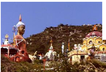
Le Mandarome à Castellane